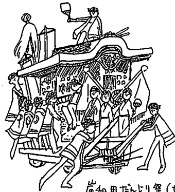
岸和田たんじり祭(和歌山)

今年のGW明けから中1男子の不登校が始まりました。まだ不登校になって間もないので泣きながら話をし、みなさんにやさしく聞いていただき気持ちが楽になりました。息子も私も誰も悪くない。後で笑って話せるようになることを信じています。(父母・東京)